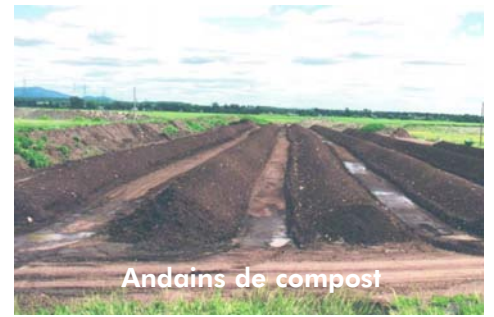
Andains de compost