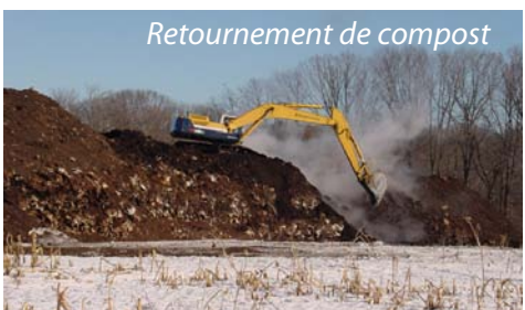
Retournement de compost

La teneur en eau est un facteur important pour l'activité des micro-organismes. Dans la pratique, il convient d'éviter une forte humidité car l'excès d'eau chasse l'air de l'espace lacunaire du tas en compostage, ce qui déclenche des conditions d'anaérobiose et une très mauvaise circulation d'air à l'intérieur du tas. Ce phénomène est assez fréquent lorsque les déchets contiennent des matériaux mouillés et peu résistants à la biodégradation. Aussi, une teneur en eau faible, inférieure à 50% du poids frais, ralentit de manière significative l'activité biologique. La teneur en eau optimale pour le processus de compostage est comprise entre 50 et 60%. Les conditions d'anaérobiose généralisées ou localisées commencent à se produire au delà de 65-70%.