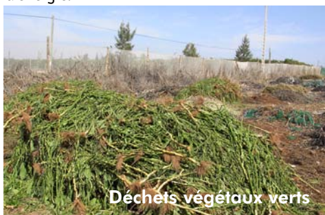
Déchets végétaux verts

Il est clair qu'à force de gagner en performances on génère des surcoûts en matière d'investissement et en fonctionnement (consommation d'énergie et maintenance). Les des systèmes décrits dans les colonnes 5 et 6 du tableau suivant sont assez onéreux et consommateurs d'énergie.