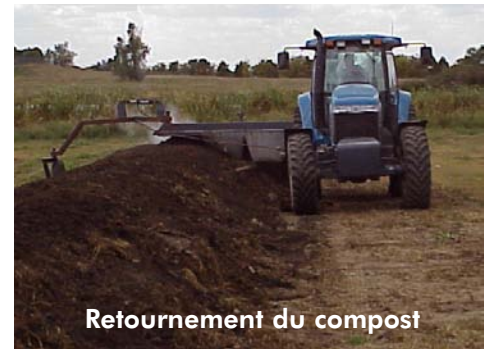
Retournement du compost