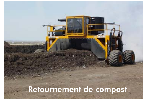
Retournement de compost

majorant la quantité de déchets de cultures, on profitera pour rehausser aussi le niveau de l'humidité.