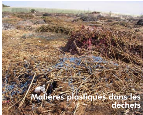
Matières plastiques dans les déchets