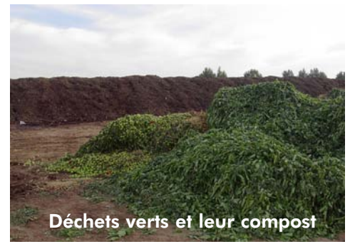
Déchets verts et leur compost

Un léger arrosage (10 % en plus) est nécessaire pour ramener la teneur en eau à 55 %. En